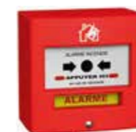
4710R1(C) Déclencheur manuel C : Disponible avec capot