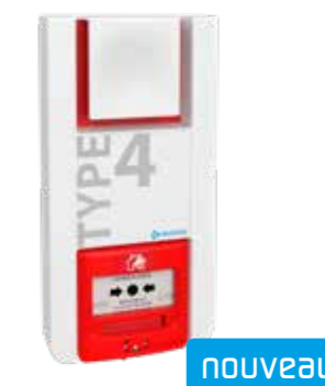
TT4PR Type 4 à piles relais