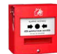
4713R1C Déclencheur manuel étanche avec capot IP65