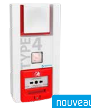
TT4PL Type 4 à piles lumineux