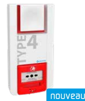
TT4P Type 4 à piles