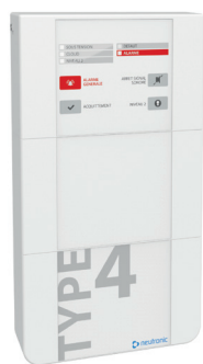
TZ4 Centrale incendie de type 4