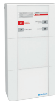
TZC Centrale de détection technique de fumée / chantier