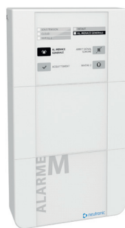
TZ5 Centrale Alarme Menace / PPMS