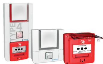
Large choix d'accessoires de Chantier et Confort